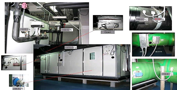
Fig. 2 AHU of clean room

هواساز مدل شده در این پژوهش دارای زیر سیستم‌های، کویل سرد و گرم، فن هوای رفت و رطوبت‌زن، "شکل 2"، که رفتار کویل سرد و گرم را به روش جعبه خاکستری و رطوبت‌زن و فن به شیوه جعبه سفید شبیه‌سازی شده‌اند.