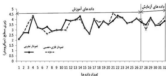
شکل ۴ مقایسه‌ی بین نتایج تجربی و نتایج خروجی از شبکه‌ی فازی-عصبی زبری سطح

هر لایه، نتایج به دست آمده از گره در لایه قبلی می‌باشد. شکل ۲ نمایی از یک شبکه فازی-عصبی با سه ورودی و یک خروجی نشان داده شده است.