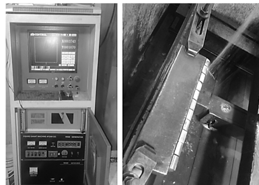
شکل ۱ نمایی از دستگاه برش کاری تخلیه الکتریکی سیمی و نمونه‌های برش-کاری شده

در سال‌های اخیر سیستم‌های هوشمند مبتنی بر مدل‌های پیشگو بطور قابل ملاحظه‌ای گسترش یافته‌اند و از مزایای آنان در علوم مختلف بهره گرفته شده است. از جمله این علوم می‌توان به فرآیندهای ساخت و تولید اشاره نمود که محققین از این روش‌ها جهت پیشبرد اهداف خود در انواع فرآیندهای تولیدی بهره برده‌اند [۱۰،۹].