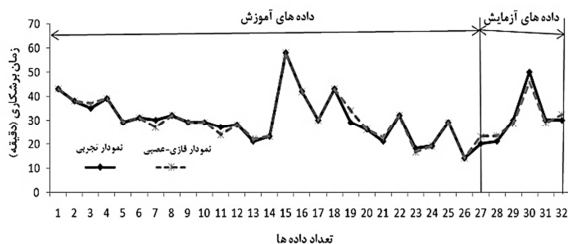
شکل ۳ مقایسه‌ی بین نتایج تجربی و نتایج خروجی از شبکه‌ی فازی-عصبی زمان برش کاری