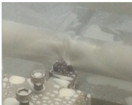
شکل ۱ دستگاه دینامومتر، ابزارگیر طراحی شده و نمونه مورد استفاده حین انجام آزمایش

در این پژوهش به‌دلیل قابلیت شبکه عصبی در ارائه مدل پیشگو برای روابط بین پارامترهای ورودی و خروجی فرآیند در فرآیندهایی با پیچیدگی زیاد از شبکه عصبی برای دستیابی به مدل پیشگوی فرآیند استفاده شده است [۹،۸]. به‌دلیل پیچیدگی‌های مدل مورد بررسی از یک شبکه عصبی با دو لایه مخفی استفاده گردید. به‌منظور تعیین پیکربندی مناسب (تعداد نرون‌ها و تابع انتقال) هر لایه از شبکه عصبی، ابتدا به‌روش سعی و خطا تابع انتقال مناسب برای هر کدام از لایه‌های مخفی و لایه خروجی شبکه عصبی انتخاب گردید.