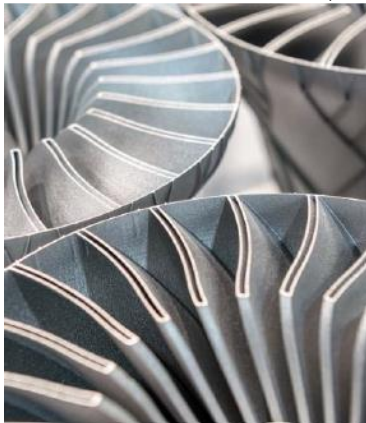
شکل ۲) پروانه فلزی ساخته شده با فناوری ساخت افزایشی

کاربرد اصلی پرینت سه‌بعدی فلزی در صنایع دریایی و صنایع وابسته، ساخت پروانه‌ها، تابلوهای صنعتی، قطعات برنزی و شیرهای صنعتی می‌باشد. به عنوان مثال، یکی از مهم‌ترین کاربردها، ساخت پروانه و تیغه‌هایی است که روش ساخت سنتی آن‌ها بسیار پیچیده و شامل چندین مرحله با استفاده از دستگاه‌هایی با ابعاد بزرگ و هزینه بالا می‌باشد. یکی از نمونه‌های ساخته شده با روش ساخت افزایشی، تیغه رانشگر توخالی با ساختار داخلی لانه زنبوری تیتانیومی می‌باشد که ساخت این محصول، باعث ایجاد تحولی عظیم در صنعت دریایی می‌باشد [5]. در شکل ۲، این پروانه قابل مشاهده است.